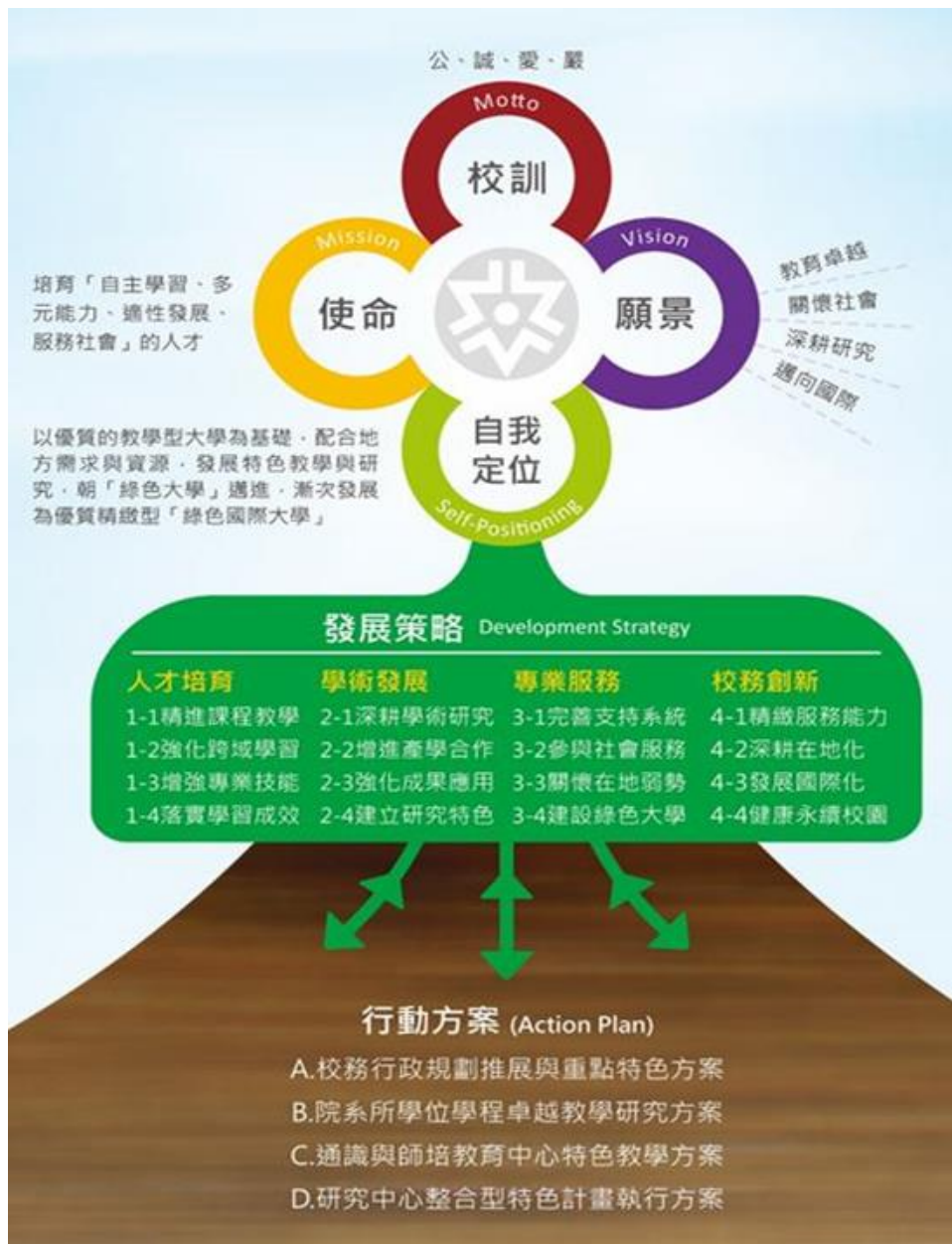
圖 1、 國立臺東大學辦學藍圖

本校105年新訂辦學藍圖（如圖1所示），強調以教學創新為主軸，配合區域治理的概念，提升和地方政府與產業的合作機制，以學術專長提供多元具體的服務善盡社會責任；並且以培育「自主學習、多元能力、適性發展、服務社會」的人才為使命，邁向「教育卓越、關懷社會、深耕研究、邁向國際」之願景，呼應大學以研究學術、培育人才、提升文化、服務社會、促進國家發展之宗旨。同時，亦將校務發展及自我定位的三階段調整為：「以優質的教學型大學為基礎，配合地方需求與資源，發展特色教學與研究，朝『綠色大學』邁進，漸次發展為優質精緻型『綠色國際大學』」，以期成為一所以支持綠色知識經濟產業發展為教學與研究基礎的國際化大學。